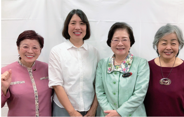
城間幹子市長を支えて頑張ります！