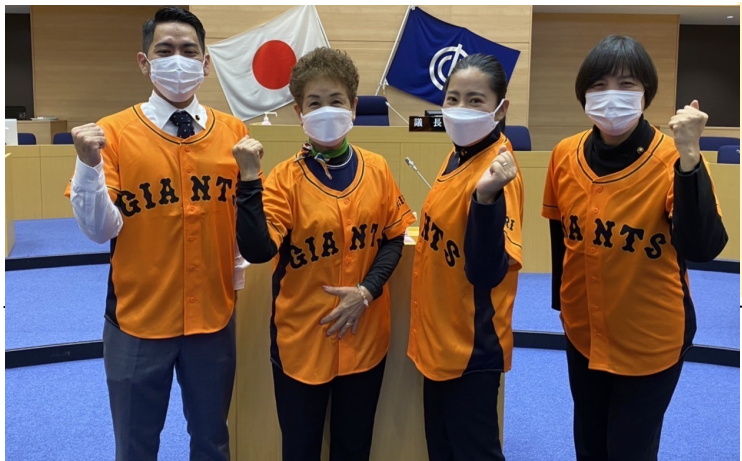
2月議会の初日はジャイアンツのユニフォームを着て開会しました。4月12日と13日には、沖縄で初の公式戦が行われます。セルラースタジアムで観戦しませんか？

意識と制度の改革をジェンダー平等の実現には、あらゆる分野での意識や制度の改革が必要だと考えています。例えば、12月に交付された子育て給付金。DV被害で避難